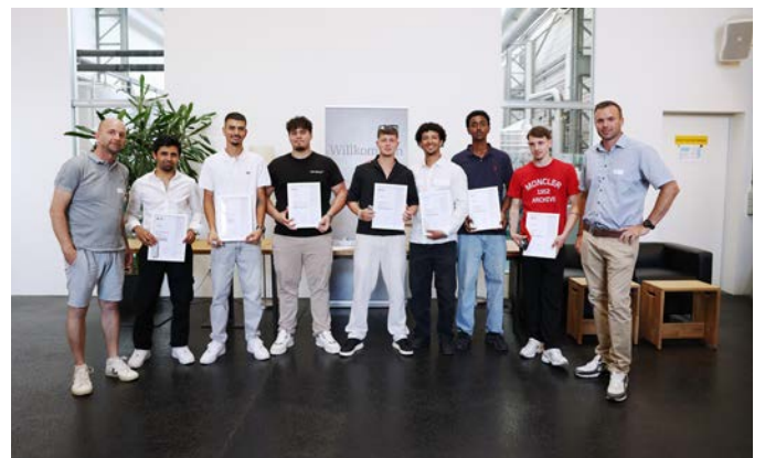
Strassenbaupraktiker EBA und Baupraktiker EBA